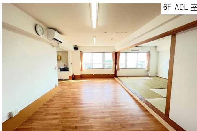
6F ADL 室