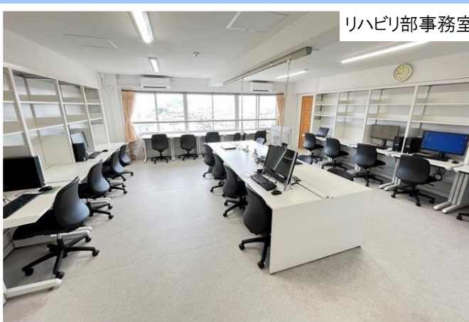
リハビリ部事務室