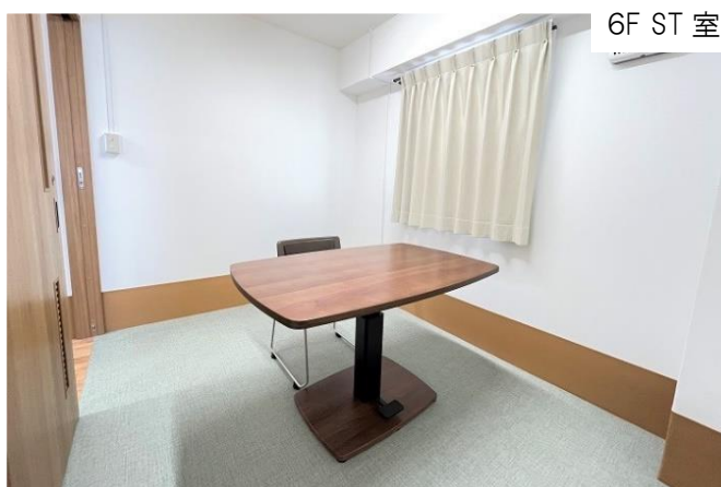
6F ST 室