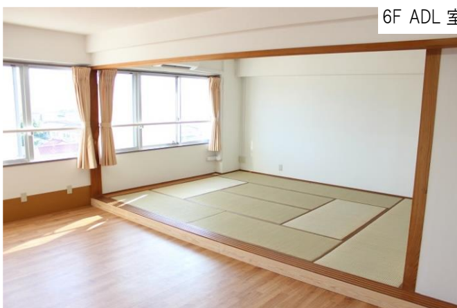
6F ADL 室